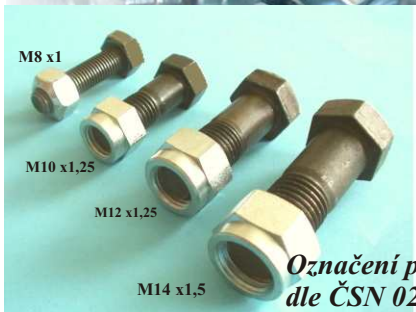
Označení pevnostního šroubu s určením pevnosti dle ČSN 02 1201.70